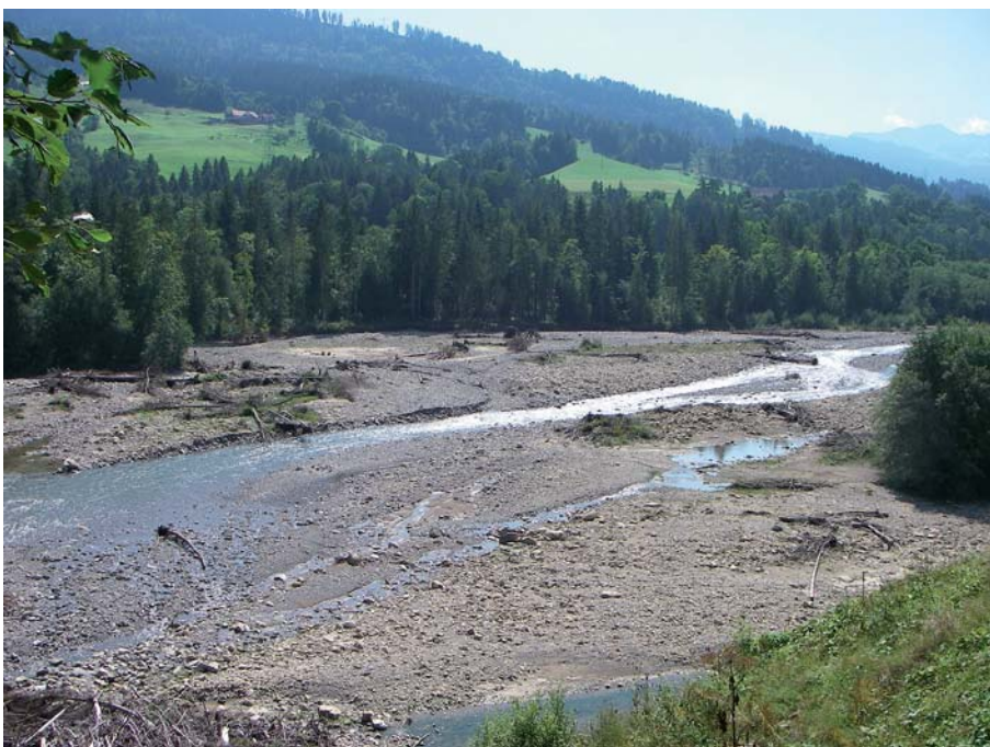
Bild 2. Sense bei Plaffeien. Der Oberlauf der Sense weist eine natürliche Morphologie und Hydrologie auf. Daher kann sie als Referenzgewässer für typenähnliche Flüsse verwendet werden.

Falls kein Baseline-Monitoring durchgeführt wurde, ist es immer noch