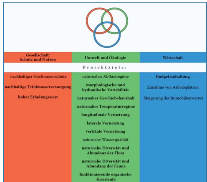
Bild 4. Mögliche Projektziele eines Flussrevitalisierungsprojekts, aus Woolsey et al., 2005.

Ausgehend vom Baseline-Monitoring, werden die Ziele für das Revitalisierungsprojekt definiert. Drei Zielebenen als Elemente der Nachhaltigkeit (BWG 2001) sind zu unterscheiden und sollen für jedes Projekt formuliert werden (Bild 4):