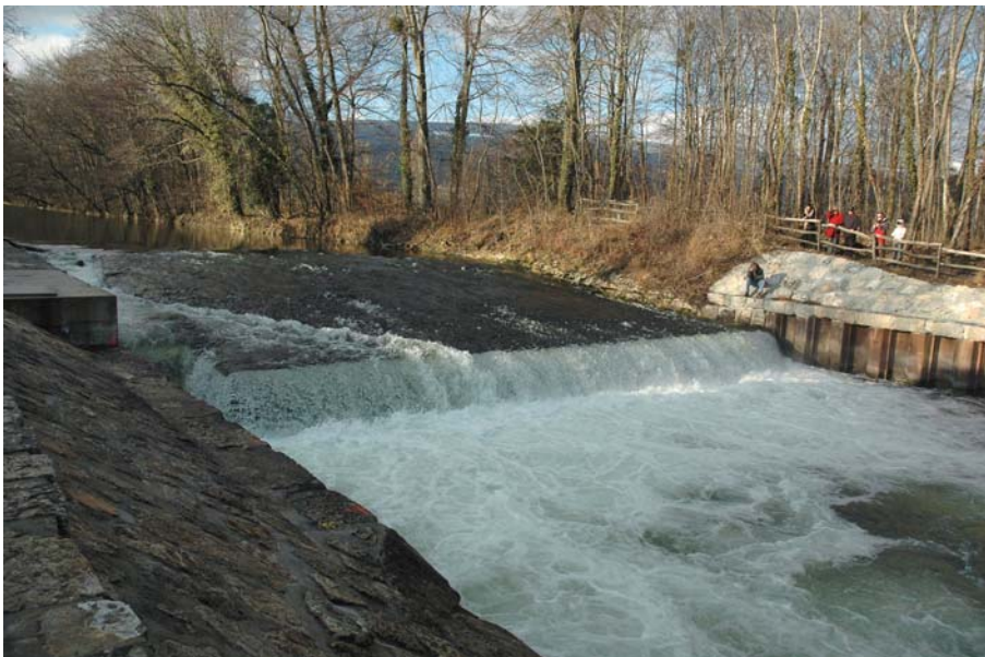
Bild 5. Künstliches Hindernis an der Areuse. In den Fließgewässern der Schweiz existieren zirka 88000 künstliche Hindernisse > 0.5 m (BAFU 2007). Diese verhindern eine rasche Wiederbesiedlung revitalisierter Flussabschnitte und sind bei der Planung von Flussrevitalisierungen einzubeziehen.

Bedeutung besitzen. An der Thur lassen sich viele Revitalisierungsziele mit der Nase ( Chondrostoma nasus ) als Flaggschiffart erklären. Die Nase ist ein anspruchsvoller Wanderfisch, der auf Strukturvielfalt, Dynamik und hindernisfreie Fließgewässer angewiesen ist. Zudem handelt es sich um eine Fischart, die in der Schweiz als «vom Aussterben bedroht» eingestuft ist. Weitere Flaggschiffarten für die Thur sind der Flussregenpfeifer ( Charadrius dubius ) oder die deutsche Tamariske ( Myricaria germanica ). Das Auftreten dieser beiden Arten ist eng mit dem Vorkommen von Kiesbänken verbunden.