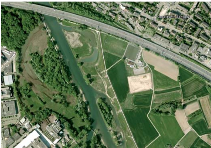
Bild 3. Flussaufweitung an der Limmat bei Geroldswil.

möglich, ein «post-treatment-design» zu verwenden. In diesem Fall werden revitalisierte Strecken mit ähnlichen, nicht revitalisierten Abschnitten innerhalb des Gewässers verglichen.