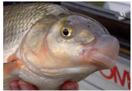
Bild 6. Nase ( Chondrostoma nasus ). Der Einbezug von Flaggschiffarten hilft, Revitalisierungsziele und angestrebte ökologische Verbesserungen einem breiten Publikum leicht verständlich zu erklären.

Ein ökonomisches Modell prognostiziert die Auswirkungen von Flussrevitalisierungen auf die lokale Wirtschaft. Für das an der Thur geplante Revitalisierungsprojekt bei Weinfeld-Bürglen wird